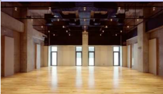
大稽古室 約100畳 1時間2,850円