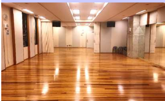
第1-2稽古室 約54畳 1時間1,900円