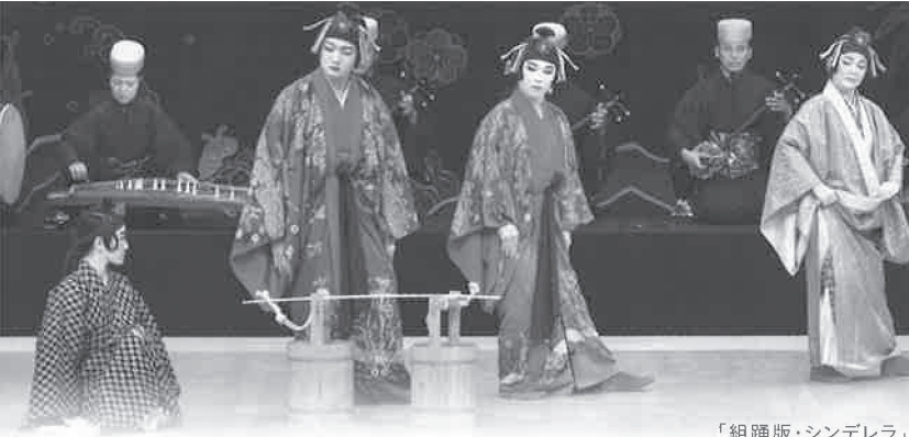
「組踊版・シンデレラ」