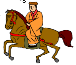
玉城朝薫 (1684～1734) 組踊の創始者

組踊は今年、国指定50周年。1972年、沖縄が本土に復帰すると同時に組踊は能、歌舞伎、文楽などと同じ国指定の重要無形文化財に指定されました。