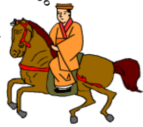
玉城朝薫 (1684～1734) 組踊の創始者

組踊は1972年沖縄が本土に復帰すると同時に、能、歌舞伎、文楽などと同じ国指定の重要無形文化財に指定されました。